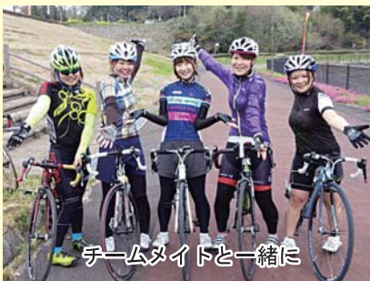
チームタイムと一緒に

ロードバイクに乗りたいたい方興味のある方は是非声をかけて下さい。一緒に走る方募集中です!!